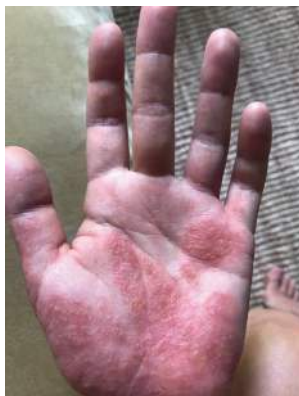
Eén week na het stoppen

Tijdens een stilleretraite van Healing Space in 2021 besloot Rosa definitief te stoppen met corticosteroïden. Het was fijn en belangrijk dat ze in een omgeving was met hulp, aangezien de detox meteen inzette. Naast de fysieke uiting van eczeem kreeg ze ook ineens last van allergie. Deze allergie kwam twee dagen na het stoppen met de zalf evenals de eczeemplekken. Vanaf hier werd het steeds erger (zie foto van een week na de eerste stopdag). Eczeem begon weer terug te komen op haar handen, en verspreidde zich later